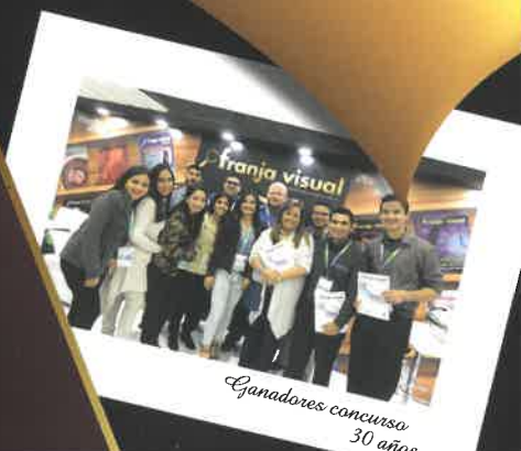
Ganadores concurso 30 años